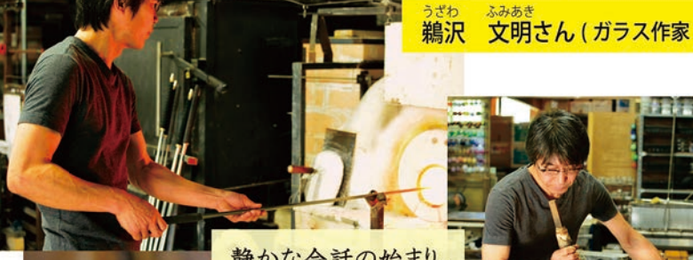
うざわ ふみあき 鶴沢 文明さん(ガラス作家)